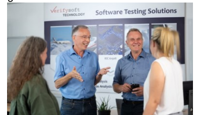
Verifysoft veille à ce que les logiciels fonctionnent correctement dans le monde entier grâce à des outils de test